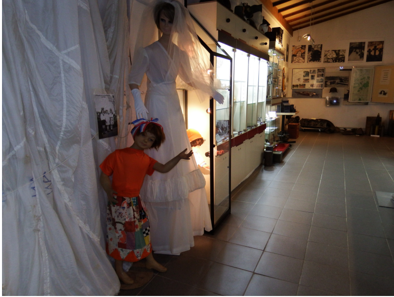
Van parachutestof werd vroeger kleding een trouwjurk gemaakt