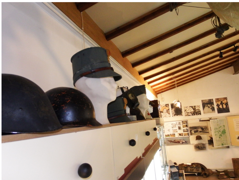
Oude soldatenhelmen op rij