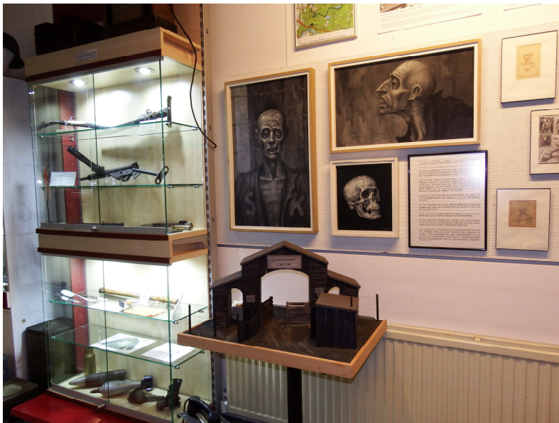
Een maquette van kamp Erika met op de achtergrond tekeningen van oud-gevangenen